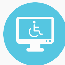
הנגשת אתרים לבעלי מוגבלויות