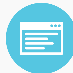
שיווק באמצעות תוכן