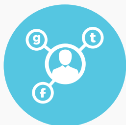
שיווק בשרשתות חברתיות

בשביל להבטיח את ההצלחה שלכם בשיווק הדיגיטלי, זזים ברשת מציע שירותי שיווק מקיפים שיעזרו לכם להשיג את היעדים אשר הצבתם.