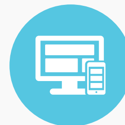
עיצוב ובניית אתרים