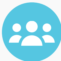
ניהול מועדון לקוחות וניוזלטר