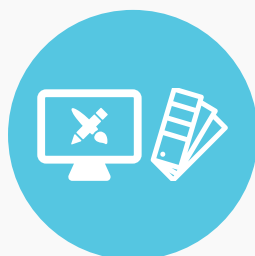
עיצוב לפרינט ולדיגיטל