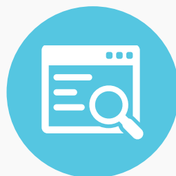
שיווק במנועי חיפוש